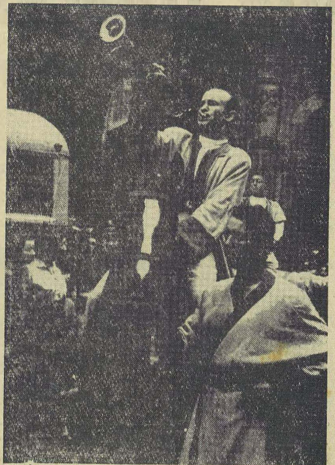
Herold obwieszcza rozpoczęcie „Dni Legnicy”

W godzinach wieczornych mimo deszczu odbyły się wszystkie uroczyste w programie imprezy a wiec — wspaniały korowód historyczny, pochod karnawałowy oraz zabawy ludowe.