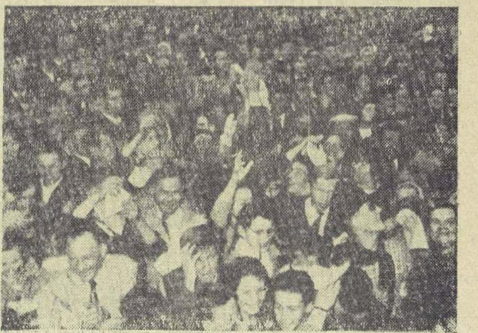
Piosenkę o Legnicy śpiewało 3 tysiące ludzi.