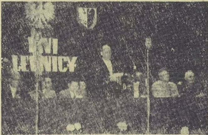
Prezydium uroczystego zebrania inauguracyjnego „Dni Legnicy”