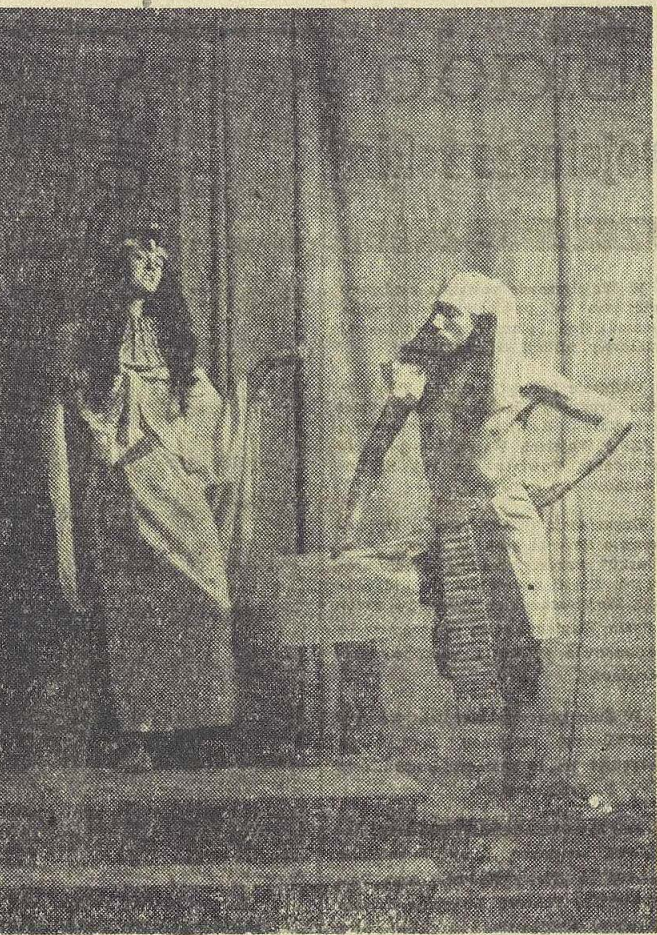
„Stroje egipskie”. Fragment pokazu mody historycznej „A jednak szata zdobi człowieka” w wykonaniu uczniów Zasadniczej Szkoły Odzieżowej im. M. Konopnickiej. Tekst mgr Z. Fleszar. Stroje i opracowanie plastyczne R. Zajac. Reżyseria H. Karliński.

— Weźmę ją do siebie — zgłosił się do Sądu ojcieci Władzi. Coś go tam widać w końcu ruszyło, skoro i alimenty zobowiązał się płacić, i zdecydował przyjąć do domu i uznać za swoje. Jak jest dla niej to i czwartę się jąkos przeżył — oświadczył.