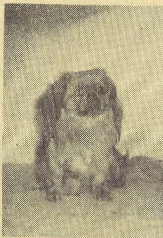
Mój przyjaciel Czarus.